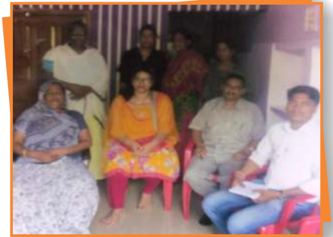
डिण्डौरी जिले में किन्नर समुदाय के कल्याणार्थ आयोजित शिविर