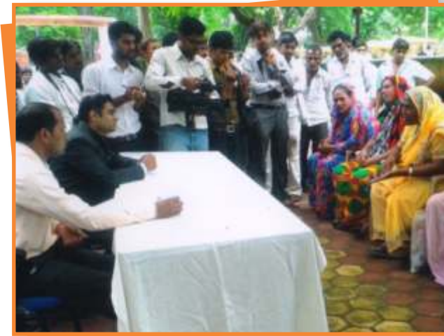
बुरहानपुर जिले में किन्नर समुदाय के कल्याणार्थ आयोजित शिविर