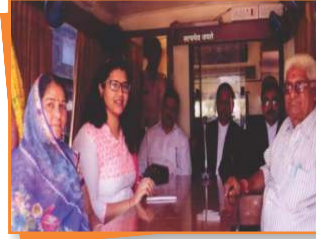
डिण्डौरी जिले में आयोजित मोबाइल लोक अदालत एवं विधिक साक्षरता शिविर