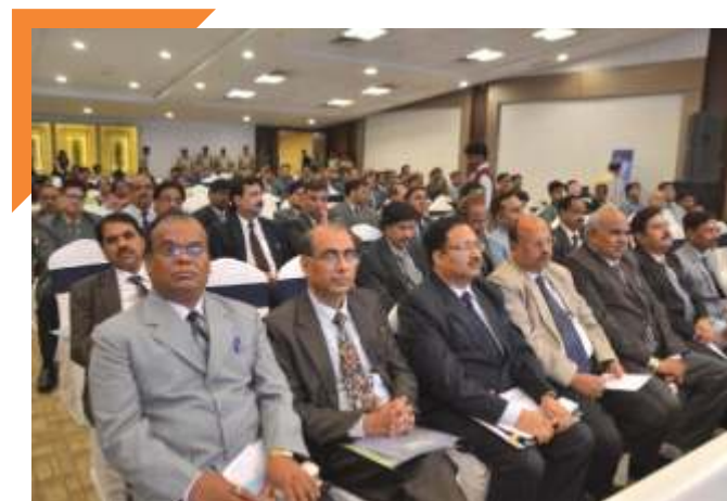
Guests and Participants from the Indore Zone