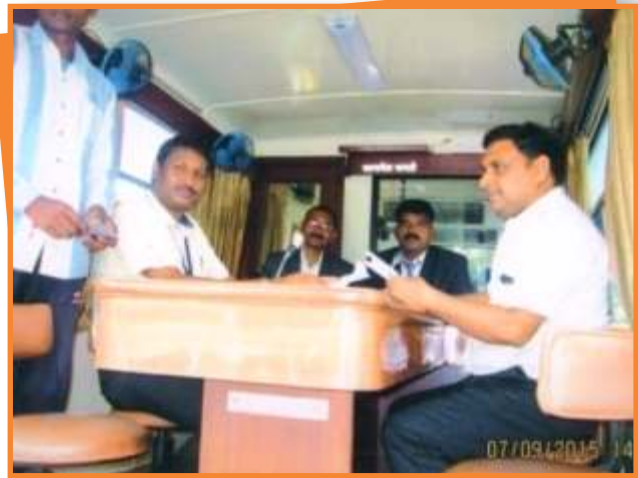
जिला मण्डला में आयोजित मोबाइल लोक अदालत में प्रकरणों का निराकरण करते हुये न्यायाधीश।