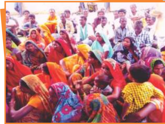
डिण्डौरी जिले में आयोजित विधिक साक्षरता शिविर