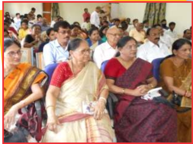
बालाघाट जिले में आयोजित मध्यस्थता जागरूकता कार्यक्रम में भाग लेते हुये प्रतिभागीगण।