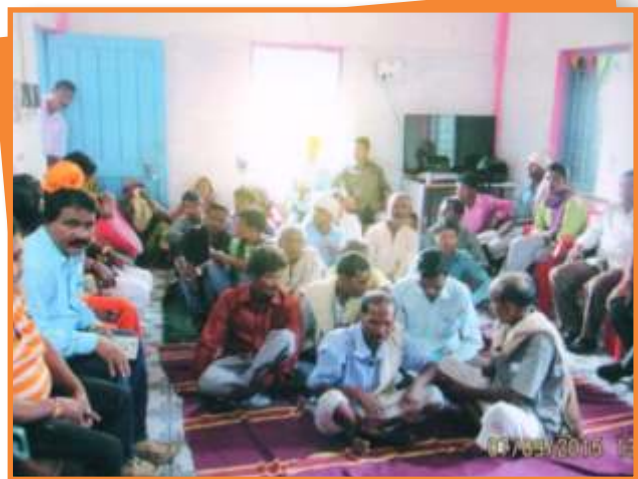
जिला मण्डला में आयोजित मोबाइल लोक अदालत में प्रकरणों का निराकरण करते हुये न्यायाधीश।