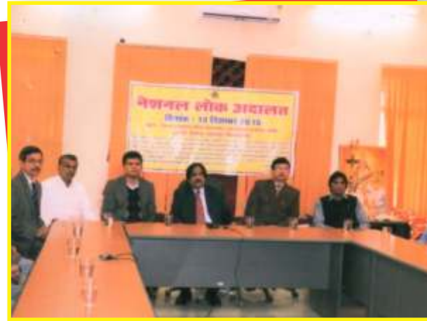
लोक अदालत का शुभारंभ करते हुये माननीय जिला एवं सत्र न्यायाधीश