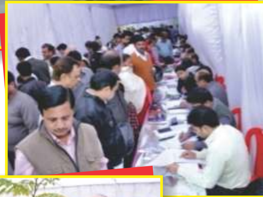
लोक अदालत का शुभारंभ करते हुये माननीय जिला एवं सत्र न्यायाधीश