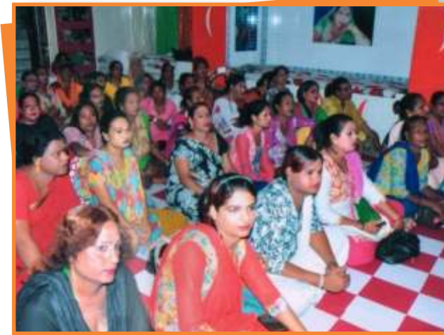
भोपाल जिले में किन्नर समुदाय के कल्याणार्थ आयोजित शिविर।