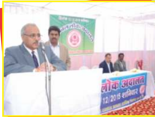
लोक अदालत का शुभारंभ करते हुये माननीय जिला एवं सत्र न्यायाधीश