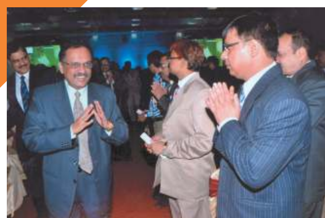
Guests and Participants from the Indore Zone