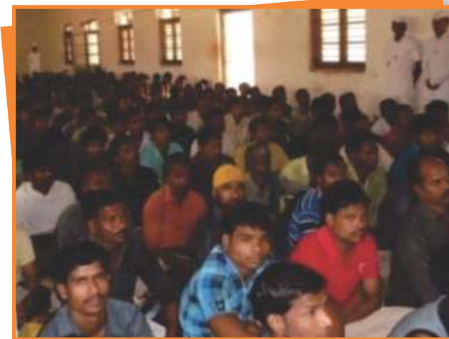
जिला जेल छिंदवाड़ा में बंदियों के अधिकारों के संरक्षण हेतु आयोजित विधिक साक्षरता शिविर